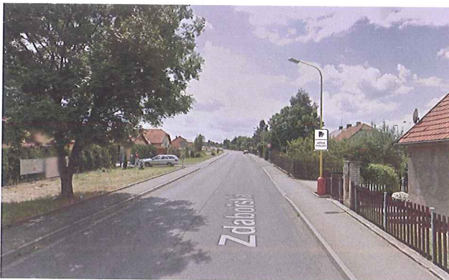
IP31a umístění 80 metrů před vjezdem do úseku ve směru z centra města na sloup VO