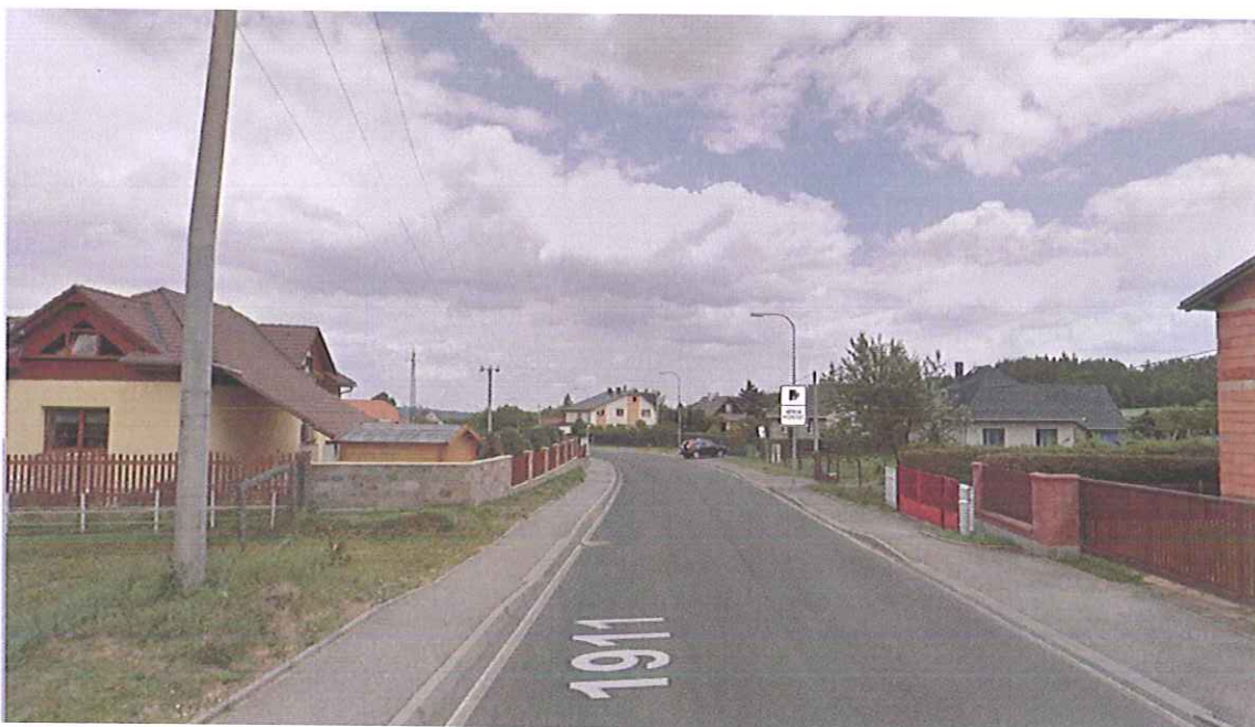
IP31a umístění 60 metrů před vjezdem do úseku ve směru do centra města na sloup VO

Pořízení a instalace DZ IP31a není zahrnuta v rámci projektu KÚSK, zařízení je určeno primárně ke sběru dat a v době realizace projektu nebude sloužit k pořizování záznamu o přestupcích v dopravě.